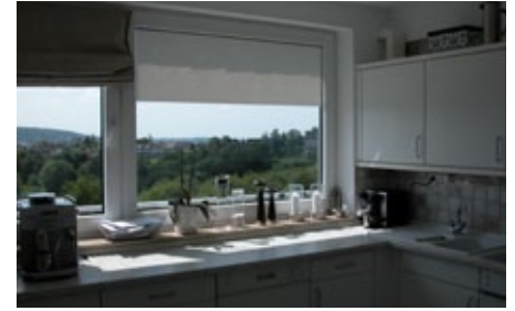
Fernblick aus der Küche