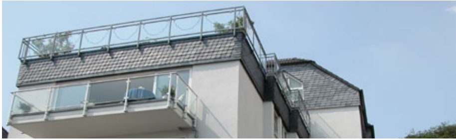
Frontalansicht auf das Gebäude