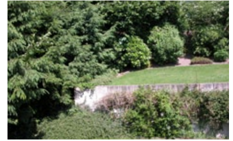
Blick in den Garten