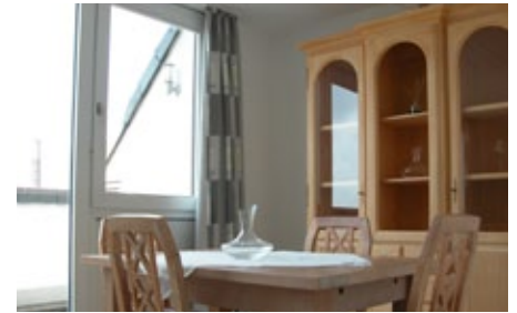
Hell und modern eingerichtet