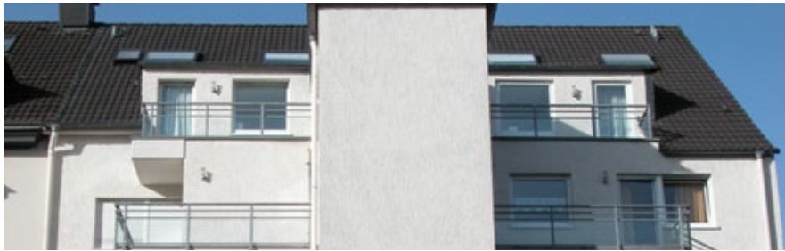
Blick auf die oberen Etagen des Gebäudes