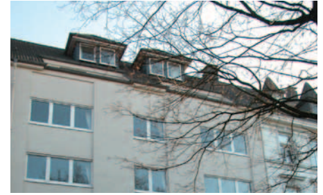
Blick auf die Vorderseite