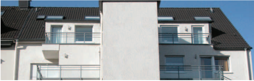
Blick auf die oberen Etagen der Rückseite des Gebäudes