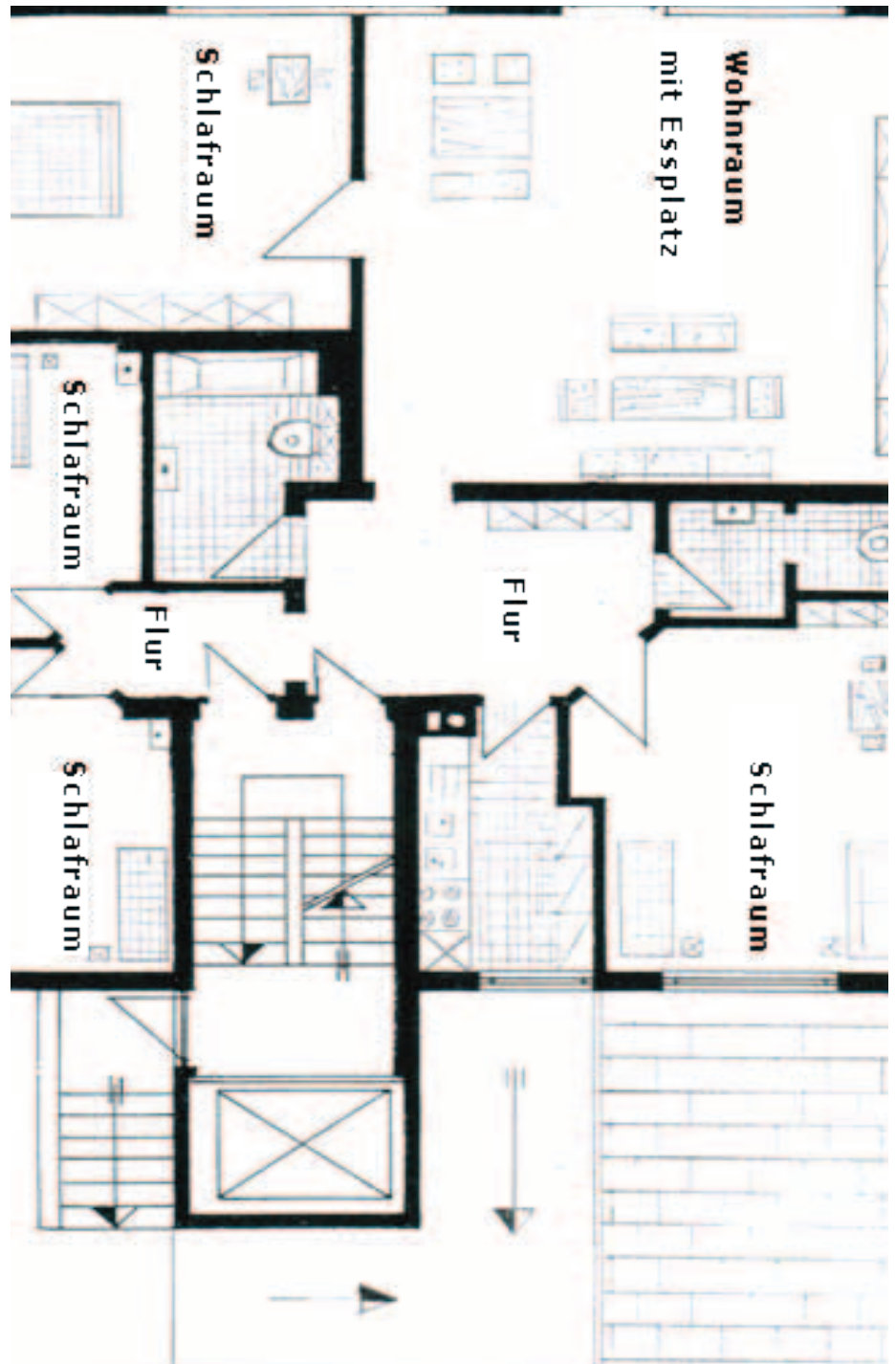
Grundriss Wohnung mit 4 Schlafzimmern