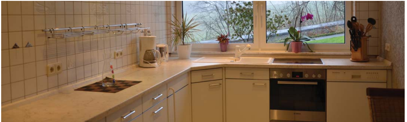
Vollständig eingerichtete Küchenzeile in offener Wohnküche