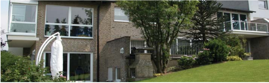
An der Gebäuderückseite schließt der gepflegte Garten an