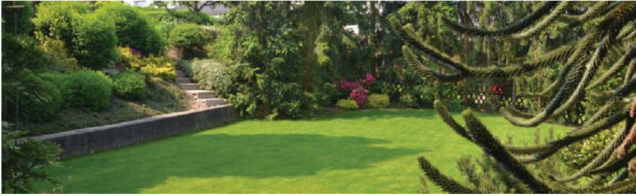
Wunderschöner und sehr gepflegte Gartenanlage