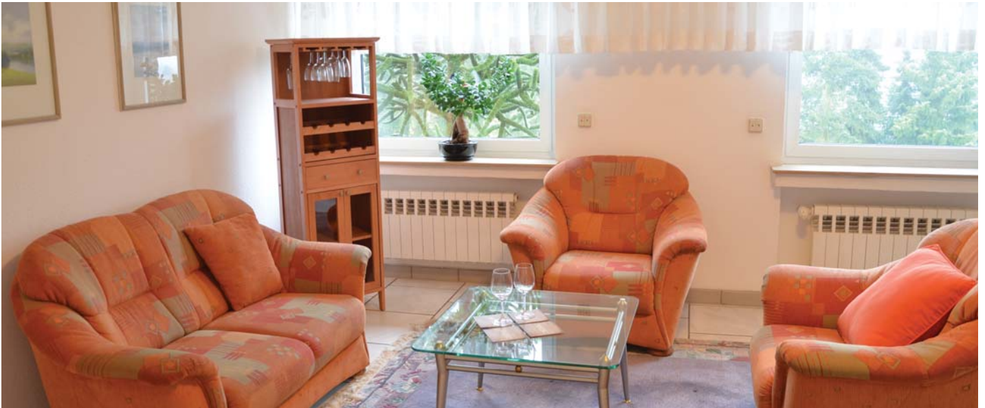
Schöner Wohn- Essbereich

Grundriss Praktisch zugeschnitten und gehoben ausgestattet