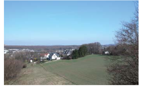
Ausblick über Vohwinkel