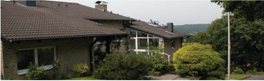
Ruhig gelegene und gehobene Wohnlage